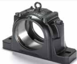
Chumacera de bloque de almohada divididas