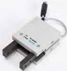
Manipulación y equipos