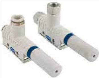
Equipos para vacío