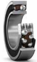
Rodamientos de bolas autoalineables