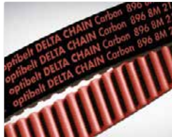
Correas dentadas de PU