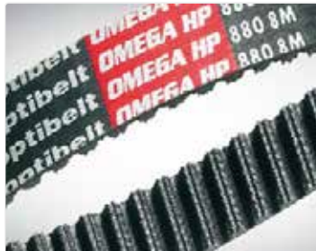
Correas dentadas de caucho