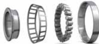
Rodamientos de rodillos cónicos