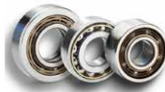
Rodamientos de bolas de contacto angular