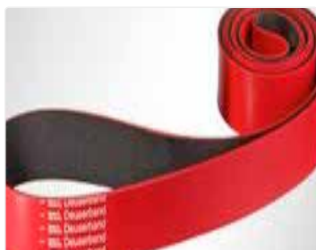
Banda elástica Deuser