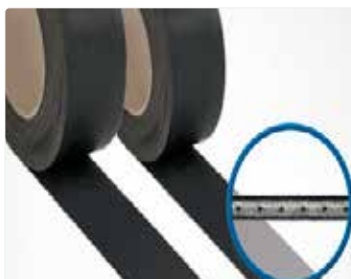
Protección contra los rayos X equipajes y mercancías