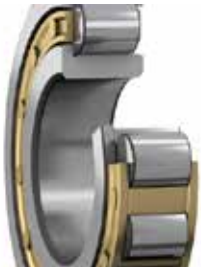
Rodamientos de rodillos cilíndricos