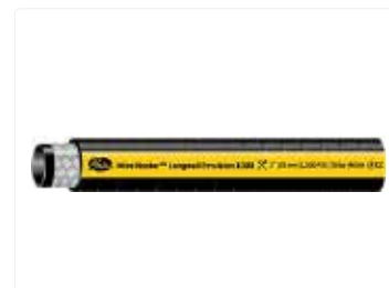
Mangueras y Acoplamientos para la minería