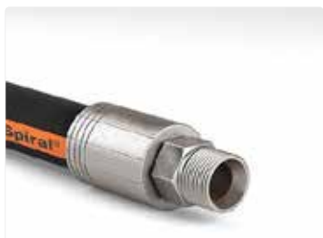
Mangueras de cable en espiral, acoplamientos y ensamblajes