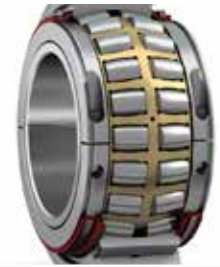
Rodamientos de rodillos partidos