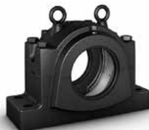
Chumacera de bloque de almohada divididas