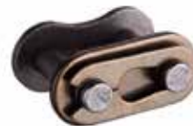
Candado para cadenas