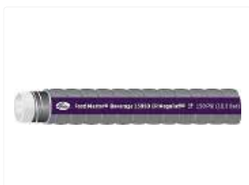
Alimentación y bebidas