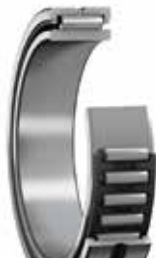
Rodamientos de agujas