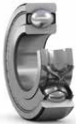
Rodamientos rígidos de bolas