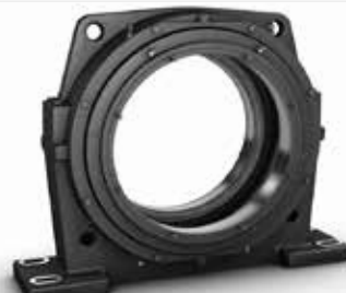
Chumacera de cojinetes de muñones para molinos