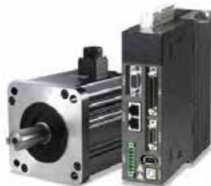
Manipulación y equipos