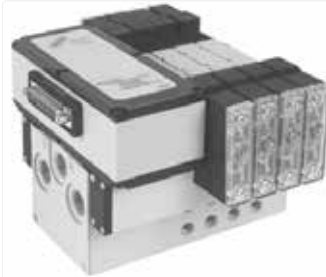
Estaciones de válvulas