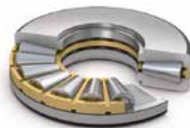
Rodamientos axiales de rodillos cónicos