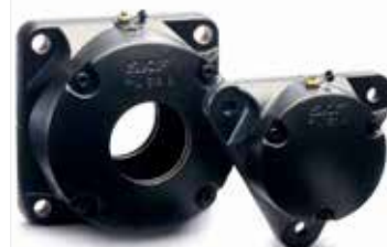
Chumacera con bridas