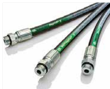
Manguera con malla trenzada, acoplamientos y ensamblajes