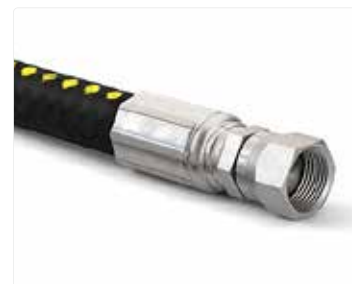
Manguera de motor