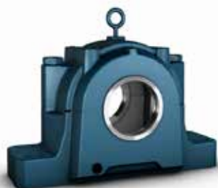
Chumacera de bloque de almohada divididas