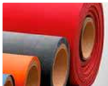
Láminas técnicas de elastómero