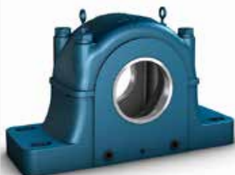
Chumacera de bloque de almohada divididas