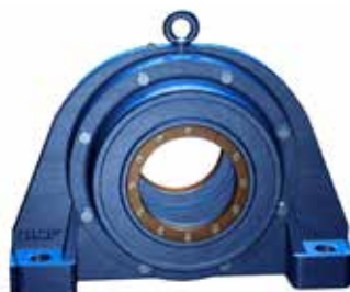
Chumacera de bloque de almohada divididas