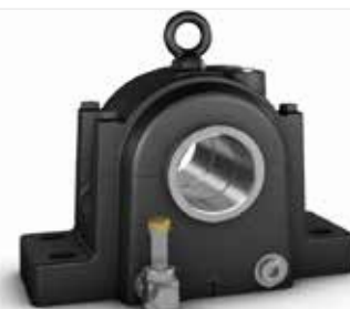
Chumacera de bloque de almohada divididas