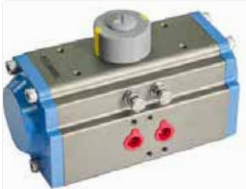
Equipos para vacío