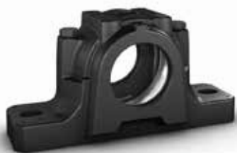
Chumacera de bloque de almohada divididas