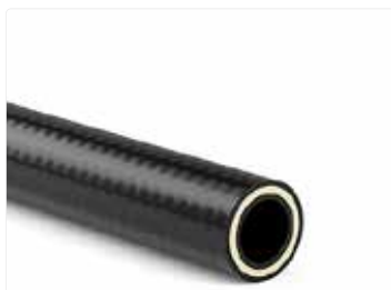
Frenos autoneumáticos/aire comprimido