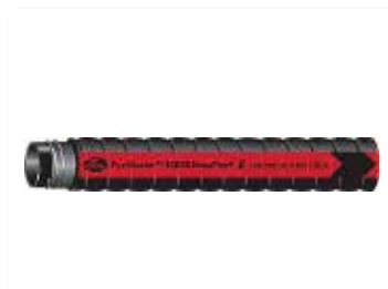
Trasvase de petróleo