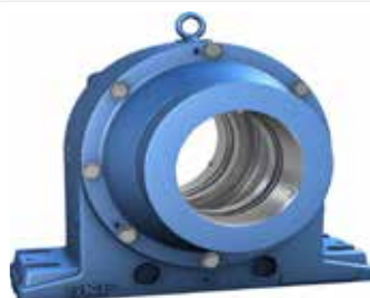
Chumacera para máquinas de papel