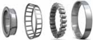
Rodamientos axiales de rodillos cilíndricos