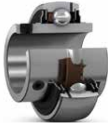
Insertar rodamientos (rodamientos Y)