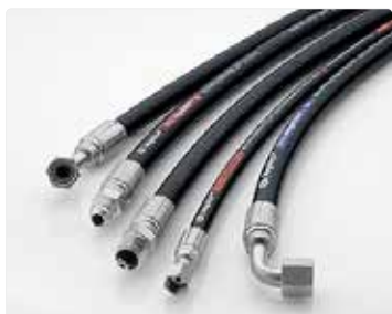
Manguera hidráulica y acoplamientos