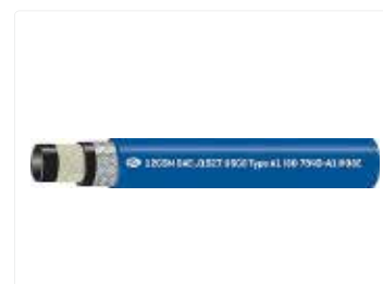
Manguera para aplicaciones marinas y motores